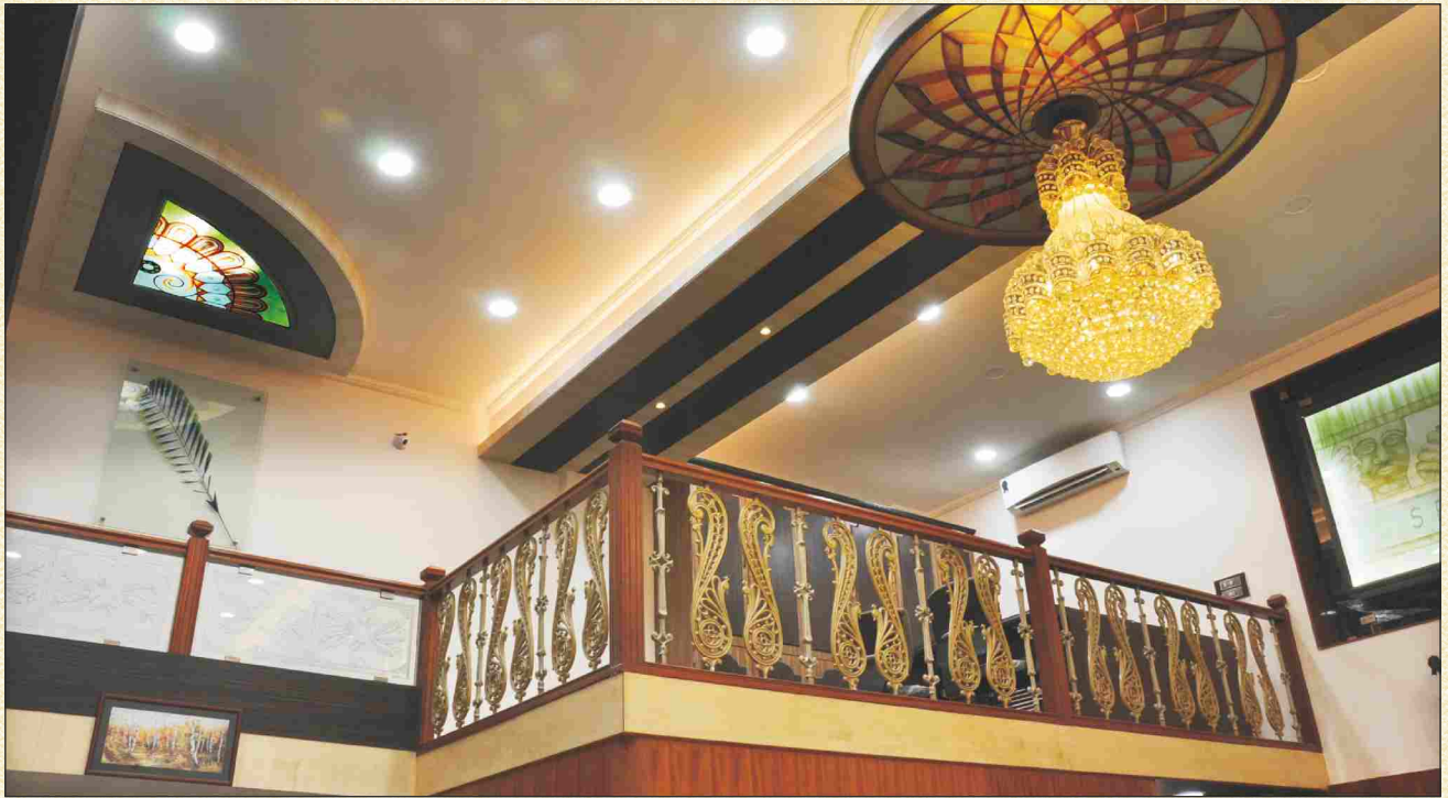
‘झुंबराच्या प्रकाशात मोरांचा थयथयाट, त्यांची पिसं कोपऱ्यातल्या रंगीबेरंगी प्रकाशात’.