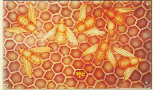
‘मधमाश्यांसारखी’ माणसं जमविली ४३ वर्षे. त्यातून उभा राहिला शहर बँकेचा ‘मधुघट’. परदेशी कलाकाराचे काचेतील म्यूरल.