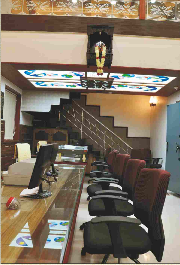
सर्व काही एका लाईनीत, सुशोभित रंगात आणि गणपतीच्या आशीर्वादाखाली.