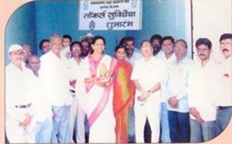
गुलमोहोर रोड शाखेतील नवीन लॉकर्स शुभारंभ