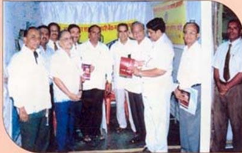
विल्ड मॅट २००६ एक्झिबिशनमध्ये हौसिंग कर्ज योजनेची माहिती देणारा बँकेचा स्टॉल