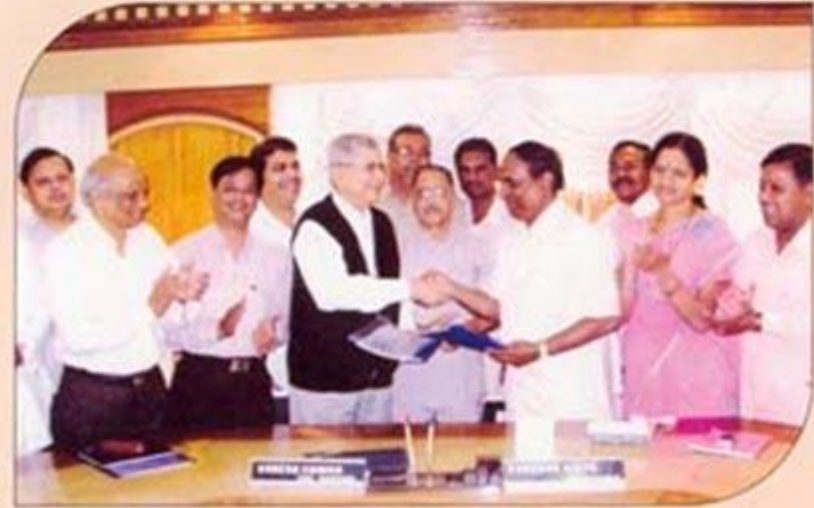
शहर बँक व शामराव विठ्ठल को-ऑप, बँक यांच्यामध्ये कोअर बँकिंग करार संपन्न झाला. सामंजस्य कराराचे आदान-प्रदान समारंभ