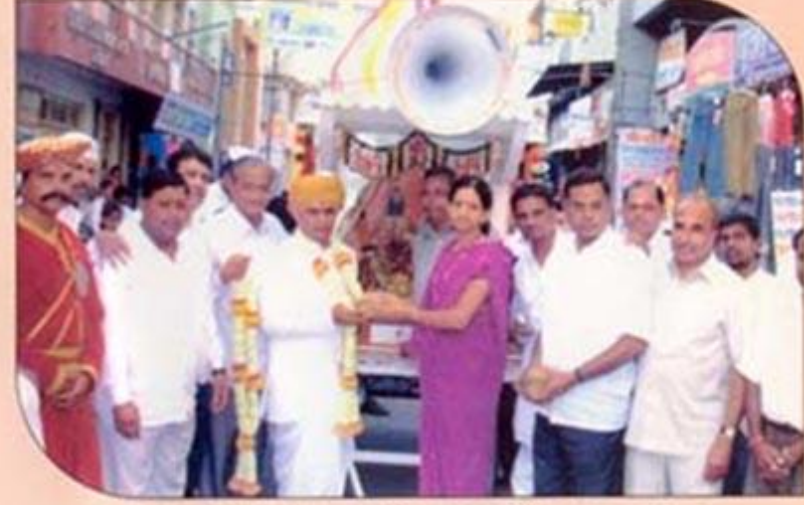
ह.भ.प. जंगलमहाराज शास्त्री व भारकरगिरी महाराज यांच्या दिंडी रथाचे बँकेतर्फे स्वागत