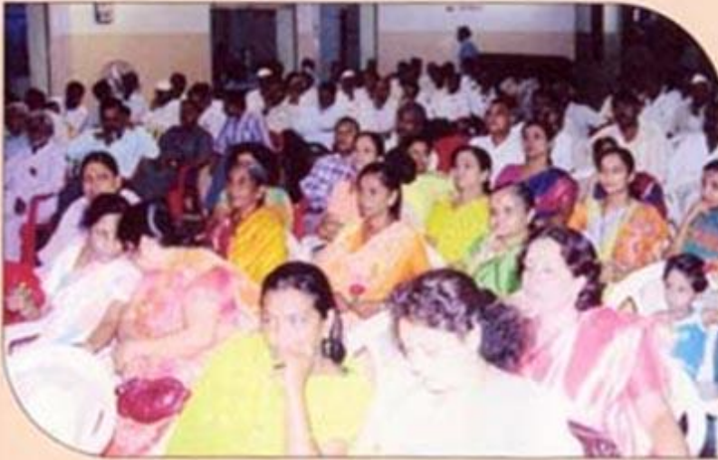
मार्केटयाड शाखा नूतन कार्यालय शुभारंभानिमित्त आयोजित कार्यक्रमास उपस्थित जनसमुदाय.