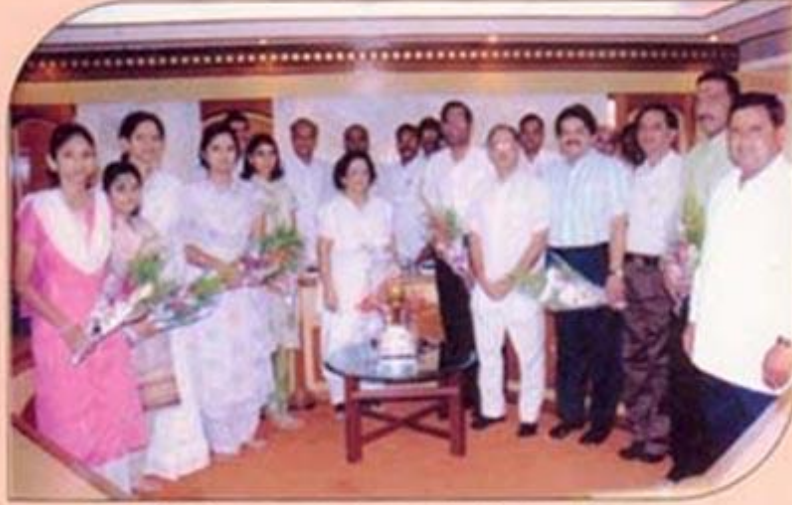
बँकेचे मान्यवर खातेदार व विद्यार्थी यांचा सत्कार